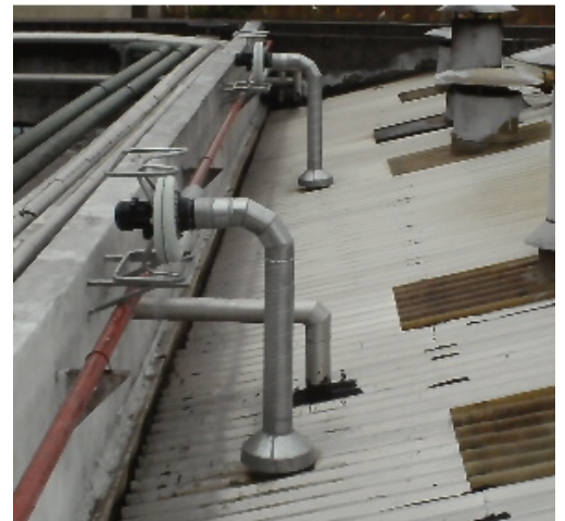
EXAUSTORES CENTRÍFUGOS MODELO N24